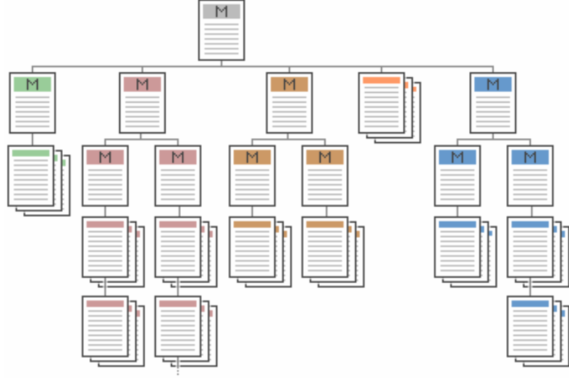
Şekil 10 Dengeli Menü Yapısı

Kamu kurumları internet sitelerinde site içi dolaşım sistemlerinin dengeli yapıda olmasına gayret gösterilmelidir. Kamu internet sitelerinde yer alan tüm sayfalar en az bir başka sayfaya bağlantı içermelidir. Her sayfa hiyerarşik yapıda bir üstünde olan sayfaya ya da ana sayfaya bağlanabilmelidir. Başka hiçbir sayfaya bağlantı içermeyen sayfalar “Çıkmaz Sokak” (Dead-End) olarak adlandırılır ve kullanıcı bu sayfalardan ancak tarayıcının sağladığı geri dönüş imkanıyla ayrılabilir. Kamu internet siteleri Çıkmaz Sokak içermemelidir.