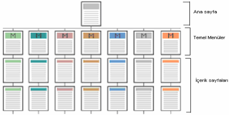
Şekil 1 Bilgi Yapılandırması

Site içinde sunulan bilgiler mantıksal anlamda tutarlı olacak şekilde organize edilmeli ve önem düzeyi de dikkate alınarak yapılandırılmalıdır. Şekil 1 'de örnek bir bilgi yapılandırılması verilmiştir. Bu yapı düzenli olup, her dokümanın kolay bulunabilmesini ve kolay geri dönüş imkanı sağlamaktadır.