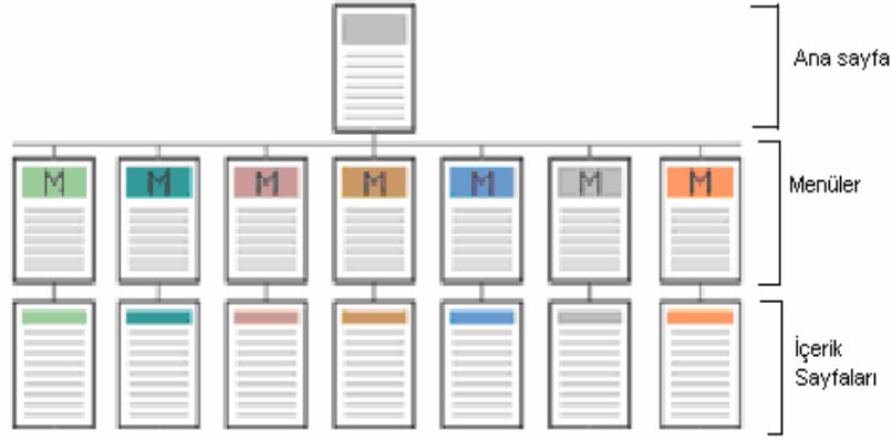
Şekil 6 Hiyerarşik Yapı

Aşağıdaki grafik bu dört tip yapılandırmanın çeşitli kriterler açısından karşılaştırmasını yapmaktadır. Grafikte yatay eksenle ilerledikçe anlaşılma zorluğu artmakta buna karşın esneklik kazanılmaktadır. Dikey eksenle ilerlemek ise karmaşıklığı artırmakta, kullanıcı bilgi düzeyinin artmasını gerektirmektedir.