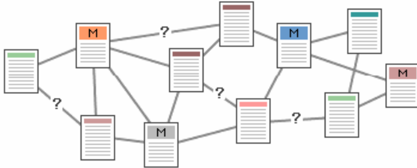
Şekil 2 Karmaşık yapı

Şekil 2 'de ise asla kurulmaması gereken bir bilgi organizasyonu gösterilmektedir. Bu örnekte, mantıksal bölümlenme yapılmamış, bağlantılar gelişigüzel verilmiştir. Sağlıklı dolaşım imkanı yoktur.