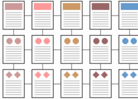
Şekil 4 Izgara Yapısı

Kullanılan bilgi organizasyonu türlerinden biri de Izgara Yapısı'dır. Bu yapıda dokümanlar arası bağlantılar bir ızgara yapısı şeklinde kurulur. Bağlantılar Bilgi Dizisi'nde olduğu gibi tek boyutlu olmayıp, her doküman tüm komşularına bağlantı içerir. Bu tür bir yapının kurulması, bazı kullanıcılar için anlama ve kullanma zorluğu yaratabilir.