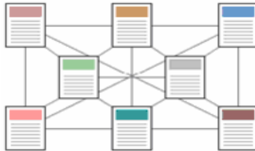
Şekil 5 Ağ Yapısı

Bu yapı getirdiği erişim kolaylığının yanında, karmaşıklığı artırmakta ve bakımı zorlaştırmaktadır.