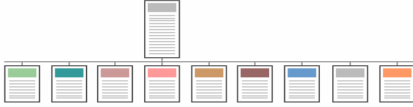
Şekil 8 Sığ Menü Yapısı

Hiyerarşik kademelerin iyi tanımlanmadığı, tüm site içeriğine doğrudan ana sayfadan bağlantı verilen yapılardır.