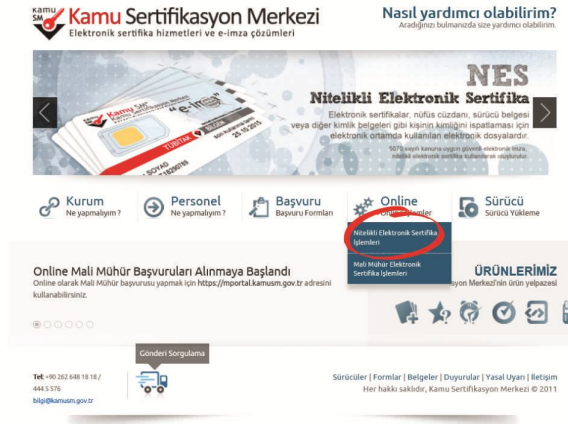
Şekil 3 Online Sertifika İşlemleri Menüsü

http://www.kamusm.gov.tr adresinde “Online İşlemler” altından “Nitelikli Elektronik Sertifika İşlemleri” linkine tıklanır.