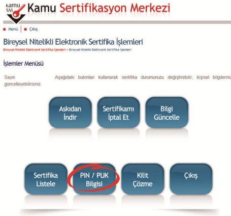
Őekil 6 Sertifika İŐlemler Menüsü

Elektronik Sertifika ile yapılacak iŐlemler iin gerekli olan PIN bilgisi, "PIN / PUK Bilgisi" butonuna tıklanarak listelenebilir.