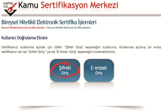
Şekil 4 Kullanıcı Doğrulama Ekranı

Açılan sayfada “Şifreli Giriş” yapılır. Daha önce Kamu SM'den alınmış ve geçerli olan bir sertifikayla giriş işlemi “E-İmzalı Giriş” butonuna tıklanarak da yapılabilir.