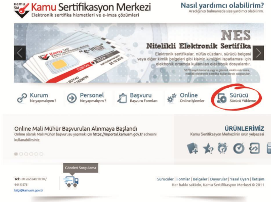
Şekil 2 Sürücü Yükleme Ekranı