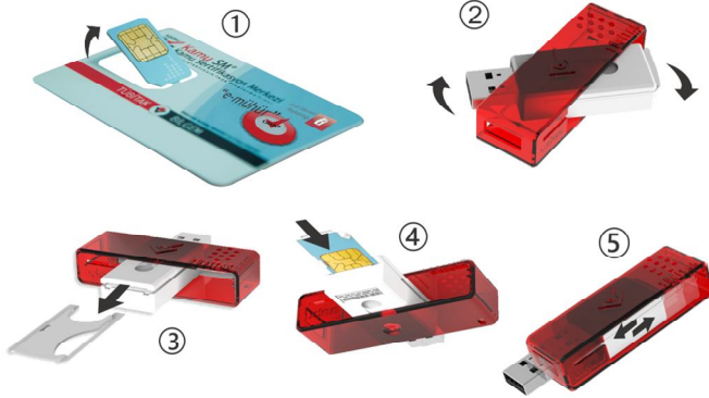
Şekil 1 Akıllı Kart ve Kart Okuyucu

Kurye tarafından tarafınıza elden teslim edilen AKİS Akıllı Kartta yer alan Mali Mühür Sertifikasının yüklü olduğu çipli parça 1 numaralı şekilde gösterildiği gibi işaretli yerlerinden hasar verilmeden kırılarak çıkarılır. Eğer kenarlarında çapak kaldıysa uygun bir aletle temizlenir. Çıkarılan çipli parça, MİLKO kart okuyucusuna aşağıdaki adımlar takip edilerek yerleştirilir. MİLKO ile ilgili detaylı bilgi için http://www.milko.com.tr adresini ziyaret edebilirsiniz.