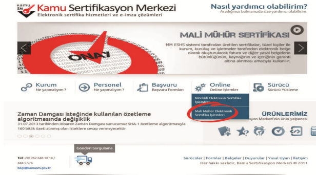
Şekil 3 Online Sertifika İşlemleri Menüsü

http://www.kamusm.gov.tr adresinde “Online İşlemler” altından “Mali Mühür Elektronik Sertifika İşlemleri” linkine tıklanır.