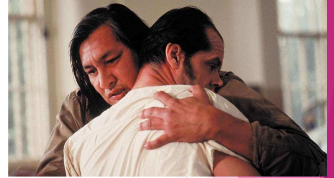
Guguk Kuşu filminde Jack Nicholson'a yapılan operasyon