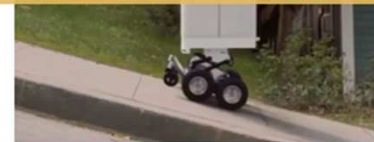
AI tabanlı robot kuryeler