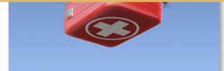
Drone ile Sağlık Servisi